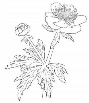
レブンキンバイソウ

黄色の花弁の様にみえるのはがく片で、花弁は雄しべよりやや長い短冊状のもの。礼文島の桃岩展望台コースにのみ分布する固有種です。