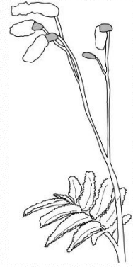
チシマワレモコウ

バラ科で径2cmほどの白い花 が茎の先に多数咲きますが、 赤味のある花も見られます。 高さは30~50cmほど。北海道 や千島列島分布し、礼文島で は草原に広く分布しています。